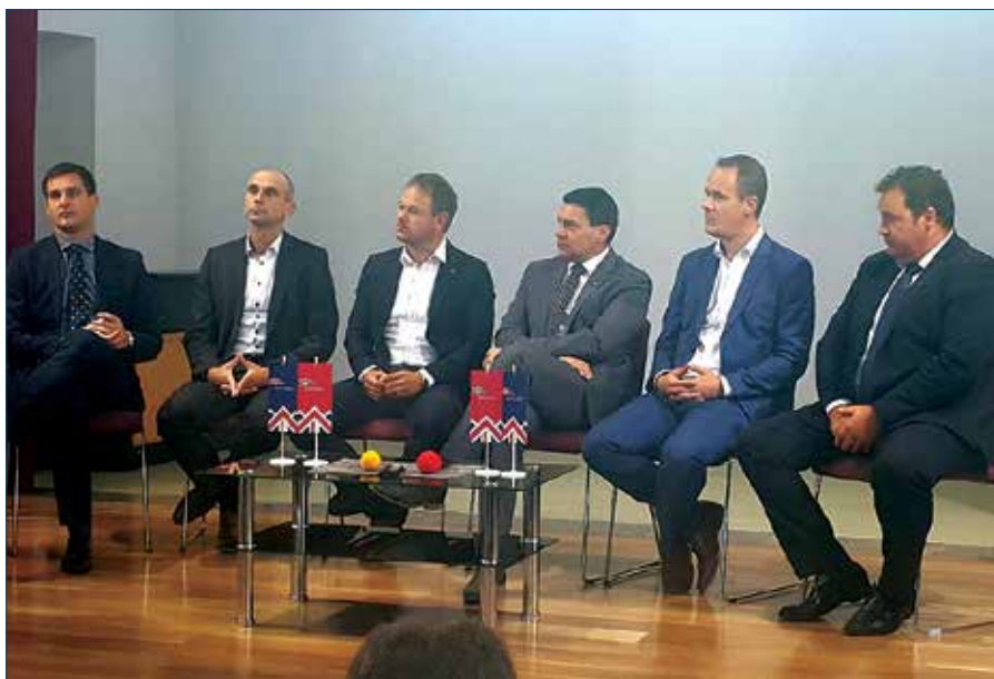
Da bi v regiji zadržali kompetentne kadre, jim je treba omogočiti nove možnosti za usposabljanje in zaposlovanje, so se strinjali udeleženci okrogle mize.

V razpravi, ki je sledila, je bilo poudarjeno, da mora država čimprej sprejeti energetske koncepte Slovenije in energetske podnebni načrt, potreben pa je tudi zakon o zapiranju Premogovnika Velenje. Termoelektrarna Šoštanj, ki je sedaj vezana na lignit iz velenjskega premogovnika, mora v času do zaprtja slednjega poiskati alternativne energen-