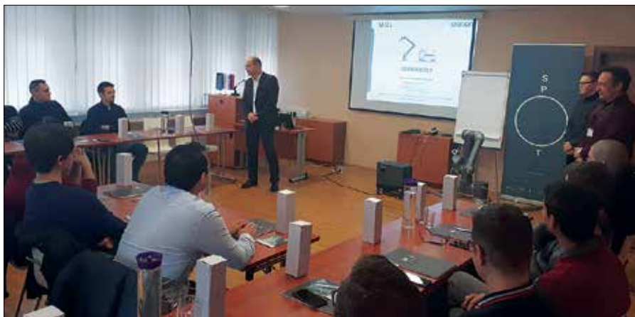
Predstavniki podjetja Miel so udeležence seznanili z značilnostmi Omron kolaborativnih robotov serije TM.