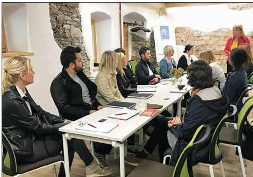
Predstavitve projekta je potekala v Herbal Glamping Resortu na Ljubnem ob Savinji.