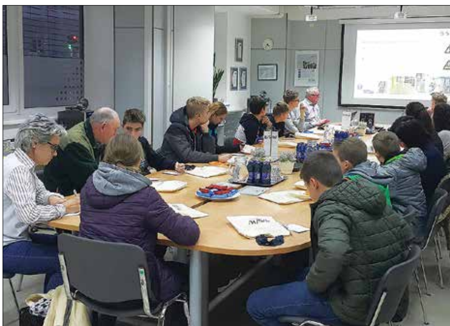
Utrinek iz uvodne predstavitve na Dnevu odprtih vrat v BSH Hišnih aparatih v Nazarjah.

Velenje, Gorenje, Gorenje Orodjarna, Premogovnik Velenje, Termoelektrarna Šoštanj, BSH Hišni aparati in KLS Ljubno, ki jih je obiskalo več kot sto zainteresiranih obiskovalcev. Slednji so dobili potrebne informacije, ki jim bodo v pomoč pri sprejemanju odločitev o nadaljnjem izobraževanju.