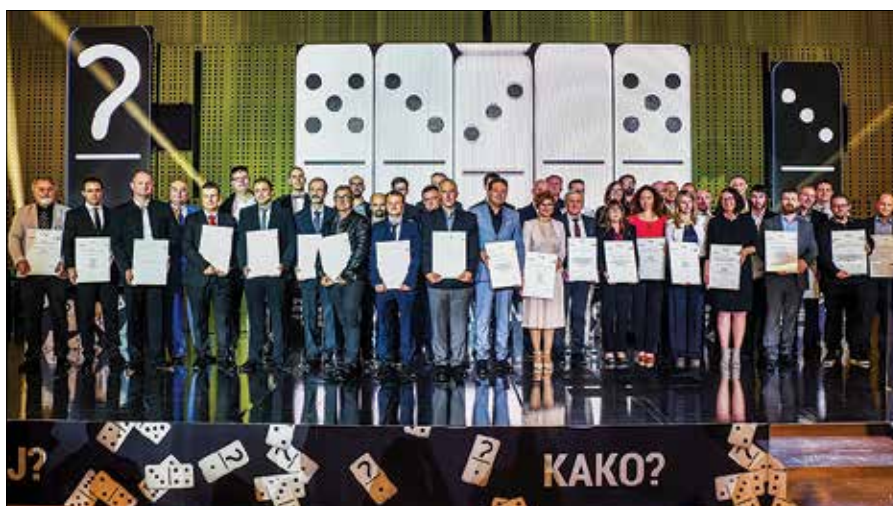
Letošnji nagrajenci za najboljše inovacije v Sloveniji

Izdajatelj: Savinjsko-šaleška gospodarska zbornica, Rudarska 6a, 3320 Velenje, tel. 03/898-4202, faks 03/898-4206, e-pošta: ssgz@ssgz.si. Odgovorni urednik: mag. Franci Kotnik. Tisk: Sašo Mažgon s.p., Arnače 35 a, 3320 Velenje. Poslovni razgledi SAŠA regije izhajajo občasno in jih brezplačno prejmejo vsi člani SŠGZ. Naklada: 200 izvodov. Na podlagi zakona o davku na dodano vrednost sodijo Poslovni razgledi SAŠA regije med proizvode, za katere se obračunava DDV po stopnji 9,5%.