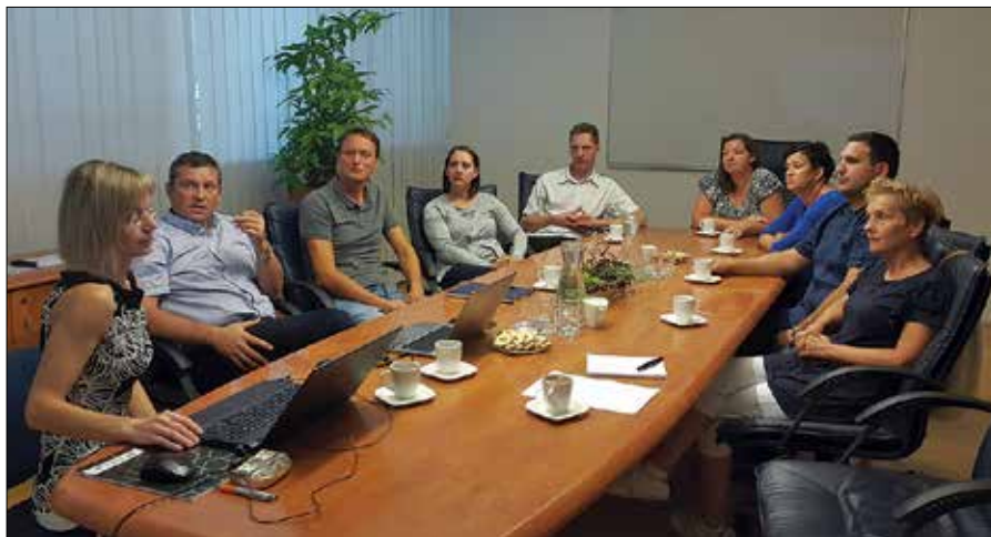
Gostitelji so obiskovalcem predstavili dejavnost podjetja Esotech in glavne specifikacije njihovega dela.

V sklepnem delu so udeleženci srečanja dobili priložnost, da gostiteljem zastavijo nekaj konkretnih vprašanj, in bili na koncu enotnega mnenja, da so tovrstne oblike izmenjave dobre prakse zelo učinkovit način izobraževanja, zato je v njihovem interesu, da ŠŠGZ z njimi nadaljuje tudi v prihodnjem letu.