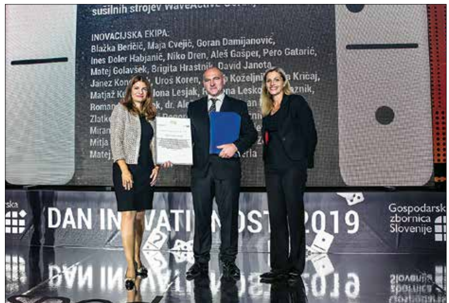
S srebrnim priznanjem je bila nagrajena nova generacija pralnih in sušilnih strojev Waveactive podjetja Gorenje

in razgradi umazanijo, ter IonTech, ki z močjo ioniziranega zraka zagotavlja 30 % boljše odstranjevanje madežev. Edinstveno oblikovan boben z rebri v obliki valja skrbi za nežno pranje oblačil. Pri sušilnih strojih tehnologija IonTech poskrbi za svež vonj, saj odstrani neprijetne vonjave, Steamtech pa s prežemanjem tkanine s paro ravna vlakna, da likanje skoraj ni potrebno. Vsi aparati generacije Gorenje WaveActive upoštevajo najvišje okolj-