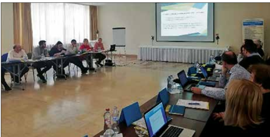
Predstavniki projektnega konzorcija pri svojem delu na srečanju na Slovaškem

Posvetovalna delavnica z deležniki za razvoj veščin bodočega velneškega turizma na območju Slovenije je potekala 17. decembra v prostorih Medpodjetniškega izobraževalnega centra v Velenju. Delavnica se je zaključila s pogostitvijo, ki so jo pripravili dijaki programa Gastronomija in turizem Šole za storitvene dejavnosti Šolskega centra Velenje.