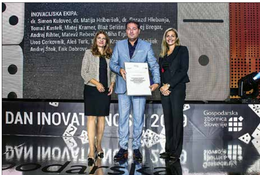
Prvič na nacionalnem ocenjevanju: inovatorji podjetja Podkrižnik z Ljubnega ob Savinji so prejeli srebrno priznanje za električni izvenkrmni pogonski sistem e'dyn 1120