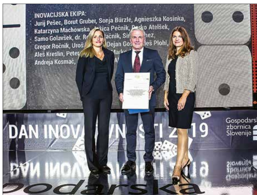
Srebrno priznanje za ročni mešalnik z lučko podjetja BSH Hišni aparati Nazarje

ske standarde in so varčni s porabo električne energije.