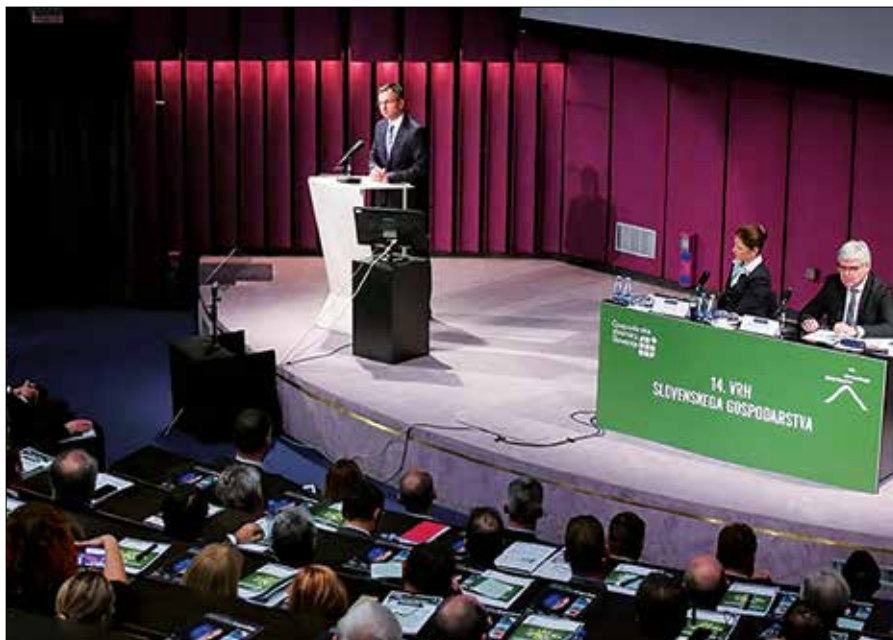
Želimo sodelovati, delati skupaj, zlasti pa skupaj uresničevati slogan Slovenija gre naprej, je povedal predsednik Vlade RS Marjan Šarec.