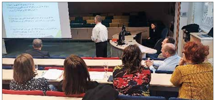
Posvetovalna delavnica z deležniki v Medpodjetniškem izobraževalnem centru v Velenju.

Pri oblikovanju skupne kvalifikacije "receptor v velneškem centru" je projektni konzorcij izdelal kvalifikacijski profil, ki temelji na transnacionalnem poklicnem profilu in upošteva značilnosti dela receptorja v velneškem centru, ki so jih identificirali delodajalci v štirih partnerskih državah. Za namene projekta WellTo je kvalifikacijski profil opredeljen kot kompleksen nabor učnih rezultatov, zasnovan v okviru strokovnih kompetenc in strokovnih ter splošnih znanj in veščin, potrebnih za njihovo